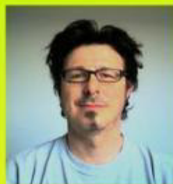
REGIS ERJ-2RM PRESSE