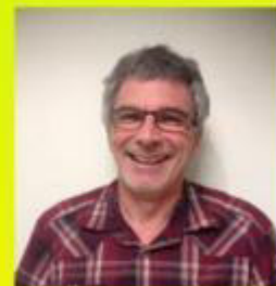
YANNICK LOGISTIQUE STOP-VOL REFÉRENT AFDM